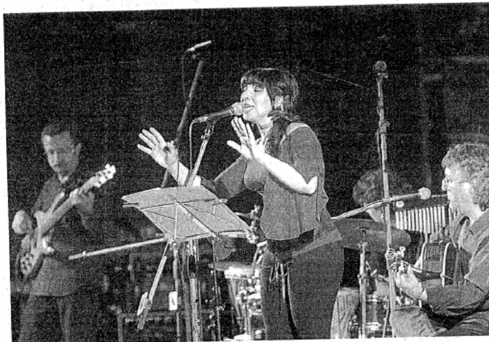
El grupo Landú, durante su actuación en el último Folk Segovia.

diendo las músicas castellana e irlandesa, que son las que cuentan con más presencia en nuestros gustos y composiciones hasta dar el producto final que ofrecemos», resumen sus componentes para explicar que apues-