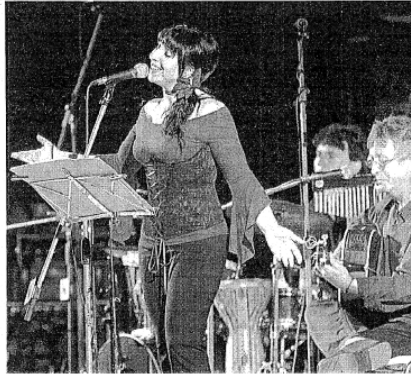
Los segovianos Landú, durante su actuación.

Previamente, le tocó el turno a la formación segoviana Landú, que sirvió su magnífico reperto-