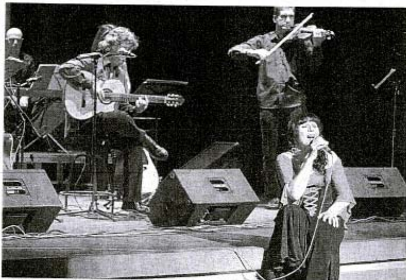
Un momento de la actuación de Landú en el teatro Juan Bravo.

Esta banda ya había dado sobradas muestras de sus cualidades en unos emocionantes conciertos que han lanzado en la capital (fantástico en Folk Segovia) y en la provincia, donde