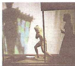
«El mago de Oz».

- 17.00 horas: Paseo de Begoña. «Teatro de la Luna Titeres» (Madrid); «Klar y Yoyo». Y