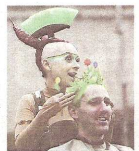
«Sienta la cabeza».

Instituto. La compañía italo-armenia «Jashgawronsky Brothers»: «Radio Armeniac».