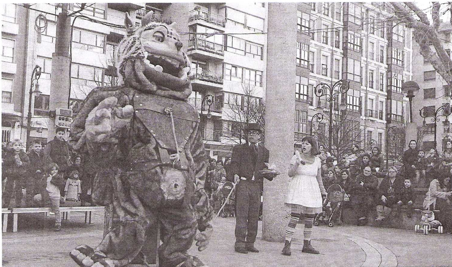
La compañía Teatro de la Luna Títeres, en el Paseo de Begoña, con su espectáculo 'Klar y Yoyo'