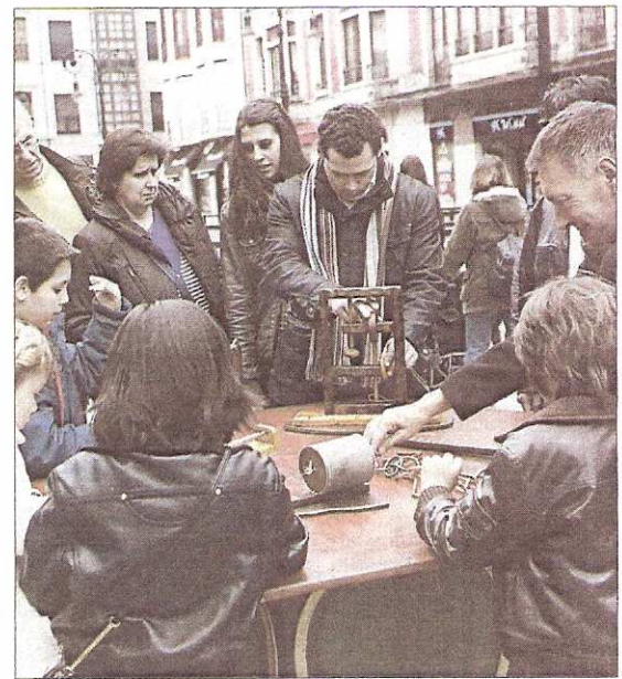
Grandes y pequeños disfrutaban con los artefactos de la Feria de los Inventos.