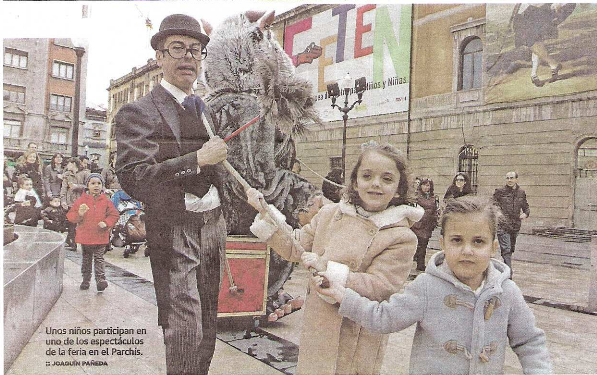
Unos niños participan en uno de los espectáculos de la feria en el Parchís.

trasos después de ocho alternativas de trazado y 30 años de debate. La falta de la declaración de impacto ambiental demorará la línea hasta 2014. P. 37